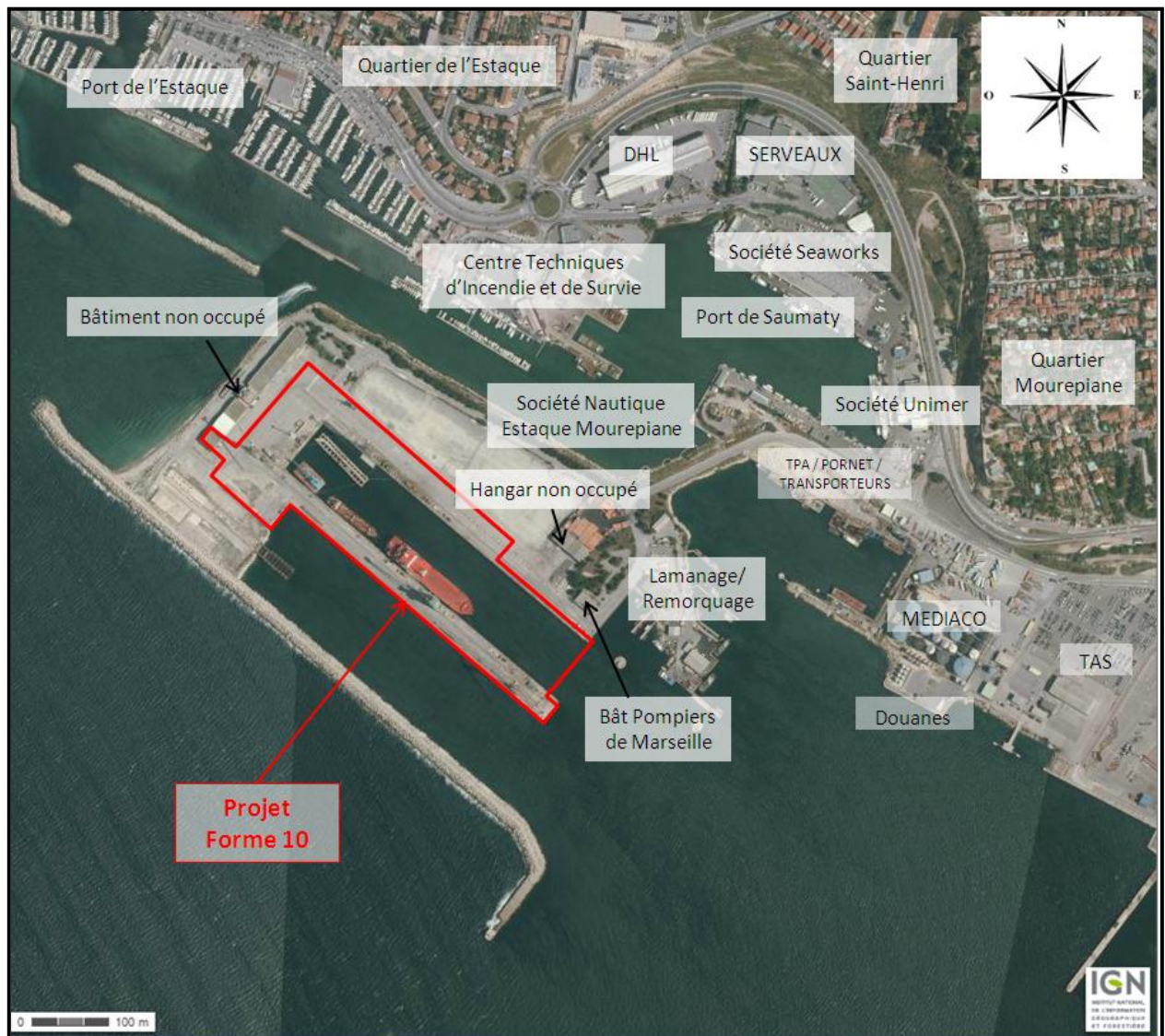
Figure 2: Vue aérienne de la forme 10

Pièce I : Résumé non-technique - Rapport n° 79119/A