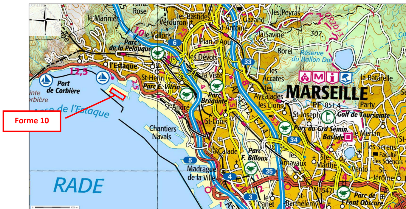
Figure 1 : Localisations générale de la forme 10

Les figures suivantes localisent la forme 10.